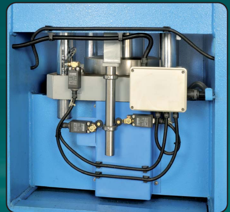
Premilamiera, Serre-tôle, Blank-holder, Blechhalter, Cojín